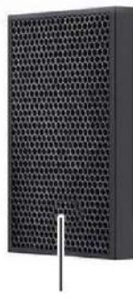
カーボン脱臭 フィルター (両サイドに搭載)