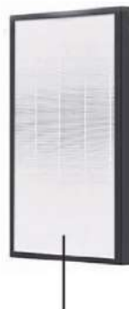
H13グレード HEPAフィルター (両サイドに搭載)