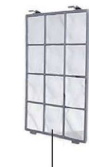
PPフィルター (両サイドに搭載)