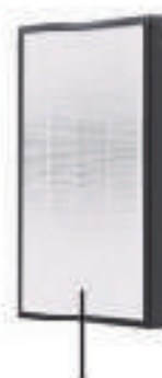
H13グレード HEPAフィルター (両サイドに搭載)