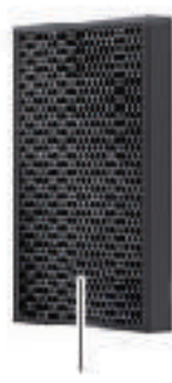
カーボン脱臭 フィルター (両サイドに搭載)