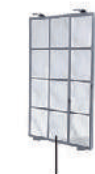
PPフィルター (両サイドに搭載)